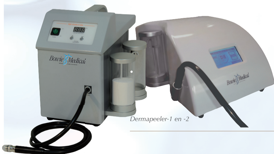
Dermapeeler-1 en -2

De nieuwe Mercurius-behandelapparatuur van Bowie Medical BV is het neusje van de zalm op